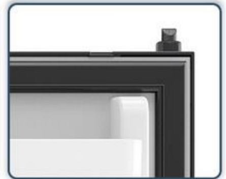
Traba y Bisagra de doble apertura (Derecha e